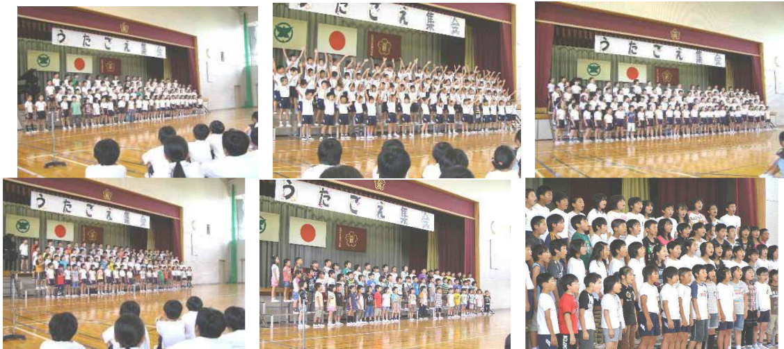
1年生「トトロ」 2年生『ドレミのうた』 3年生「海風きって」 4年生は「歌の虹」 5年生「フレンドシップ」 6年生「レッツ サーチ・・・」

7月1日(木)「歌声集会」 校区の道徳教育実行委員、ご家族の皆様にも参観していただきました。ありがとうございました。大野小児童会の宝もの一つである「心に響く合唱」の取組の成果を、学年ごとに発表しました。学年に応じたすてきな歌声でした。特に高学年は、昨年度の3月に、卒業生から引き継いだこの伝統を、さらに高めようと練習を続けてきました。声の響き、リズムや音程などにも成果は出ていますが、歌い手の気持ちの表現、表情は、これまでの伝統をぬりかえるほどの出来映えでした。