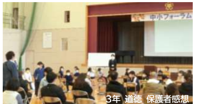
3年 道徳 保護者感想