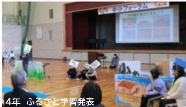
4年 ふるさと学習発表

さらに、参観された皆様に受付にて「ひとことカード」のお願いをしたところ、何と130枚もの感想をいただきました。児童にとっても職員にとっても、励みとなる温かい言葉ばかりでした。重ねて感謝申し上げます。