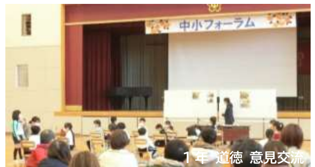
1年 道徳 意見交流

児童は、この参観を一つの目標とし聞く・話す力を高めようと取り組んできたことを発揮できていました。満足感・達成感が味わえたと思います。保護者の皆様にお寄せいただいた感想にも、学校の様子が分かってよかった、子どもたちがとてもよく頑張っていたとの声を多数いただきました。