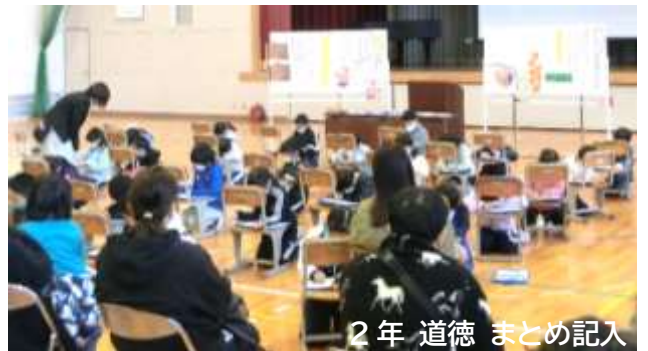
2年 道徳 まとめ記入