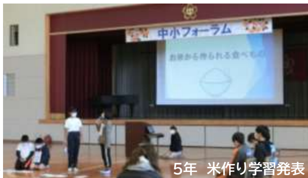
5年 米作り学習発表