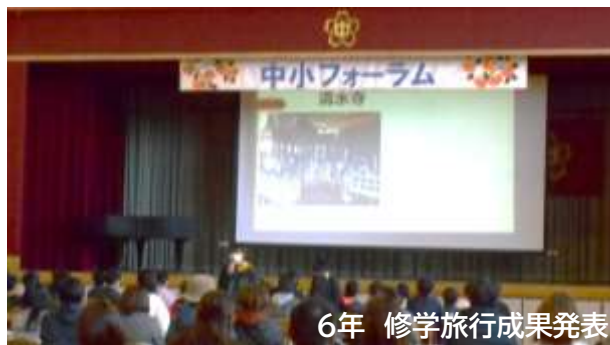
6年 修学旅行成果発表

【1年生】皆が静かに話を聞いていて、すごいなあと思いました。自分の考えもはっきり話せていて素晴らしかったです。