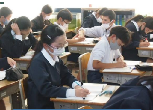
子どもに寄り添って指導中