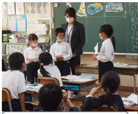
全体の前で発表するグループ