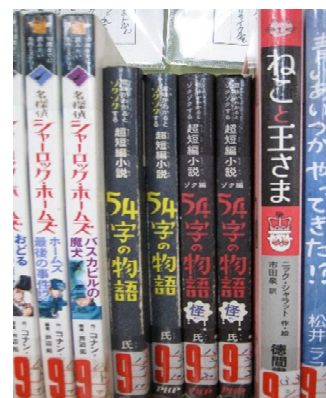
4年教室に置かれる本

夏休みには、1年生が、家庭教育学級の一環として親子読書に取り組んでくださいました。ぜひ、家族で「読書の秋」を楽しんでください。