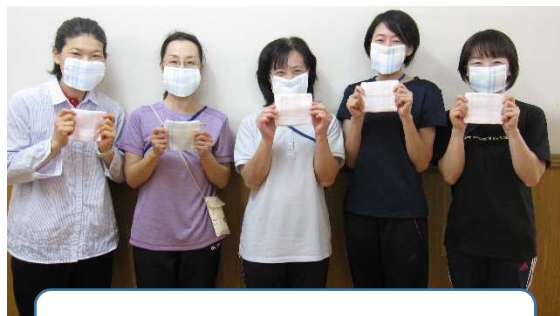
結小学校の児童支援員の先生方

休業期間中に、児童が学習で使用するミシンの状態を確かめながら、支援員の方や校務員さんにマスクを作っていただきました。布地はPTAよりいただきました。布地が3重になっていて少し厚めのマスクになっていますが、布地の間に不織布を入れることができるように工夫して作っていただきました。5・6年生は、家庭科の学習の発展として、自分で作ることができますので、布地を渡しました。記名の上、使用してください。