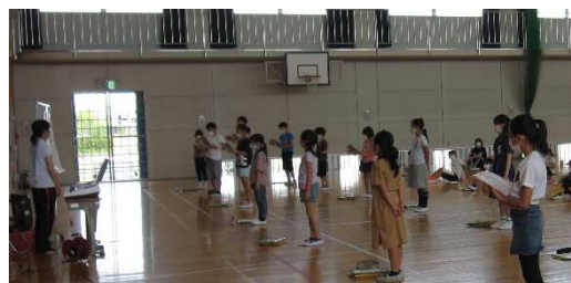
音楽専科教員から 体育館で音楽を学ぶ4年生

今週は、天候に恵まれ、雨の日は1日ありませんでした。それとは反対に、気温が30度を超えるような日もあり、自宅から学校までの距離がある地区の子どもたちは、通学だけでも汗びしょりになるのですが、自分の足で歩いて登校できる子が多かったです。見守り隊の皆様や保護者の皆様のおかげで、安全に登下校できました。下校時には、広がって歩く姿もありますので、今後学校でも指導して参りますが、お声かけいただけるとより安全意識が高まると思います。よろしくお願いします。