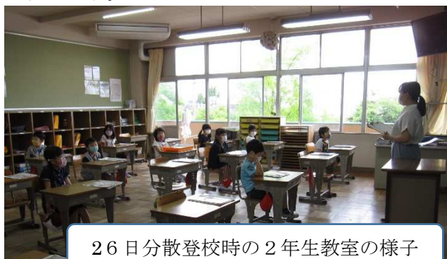
26日分散登校時の2年生教室の様子

プラス活動は、伝統的な活動です。子どもたちも3ヶ月間も楽器に触っておらず、早く曲を演奏したいと思っている子が多くいます。プラス活動に際しては、楽器隊は3密を避けるために4人程度ごとに部屋を分けるなどの工夫をして活動を進めます。また、金管楽器は、マウスピースを自宅に持ち帰って練習します。保護者の方で金管楽器の指導ができる方がいらっしゃいましたら、ぜひとも子どもたちの指導にお力添えいただければと思います。（校内では、隔週の金曜日の昼休みや6時間目のプラス活動の時間帯で活動します。時間が合えば、ボランティアでお力添えいただければと思います。）