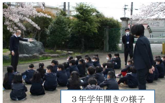
3年学年開きの様子

その後の学級活動では、担任の先生と共に学級開きを行い、クラス替えにより新しく同じ学級になった仲間を知り、担任の自己紹介や願いを聞いて、先生や友達とどんな学級にしようか考えました。子どもたちと願いを共有できた学級は、学級目標まで決定しました。新型コロナウイルス感染拡大防止のために、学校が臨時休業され、学校に来ることが「当たり前」と考えていたのですが、この「当たり前」の難しさを痛感する今年度の始まりとなりました。しかし、現在の所、結小学校の全児童・保護者の皆様が、健康でいらっしゃることが確認できて、まずは一安心しました。