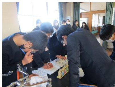
6年 理科の実験結果を班で確認

また、授業後には学級懇談会を行いました。各担任から、この1年を振り返り、できるようになった成果と、3月に少しでも改善して終わりたい課題をお話ししました。保護者の皆様には、今年も本校の教育活動にご理解とご協力を賜り、誠にありがとうございました。残り1ヶ月で、今の学年をしっかりと締めくくれるように全職員で努めていきます。