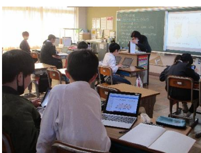
5年 タブレットを使った算数