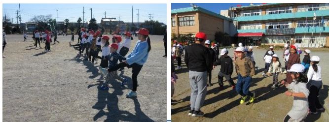
高学年のリードで、楽しく遊ぶことができました。

大縄跳びで、低学年の子が跳びやすいように縄をタイミングよく回す姿、ゲームのルールを知らない子に優しく教える姿、転んだ子に寄り添い心配する姿。このような姿から、相手を思いやる心、上級生に憧れる心が育っていることが感じられます。3月に最後の縦割り活動があります。6年生との楽しい思い出ができることを期待しています。