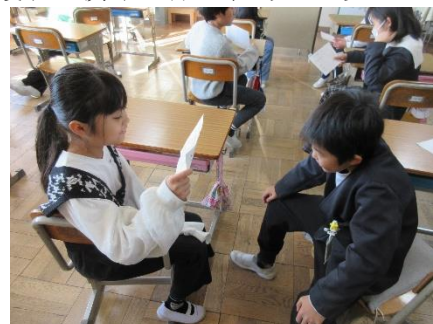
相手にきちんと話せるか、確かめました

なお、「安全カード」は、個人情報となりますので家庭へ返却します。よろしくお願いいたします。