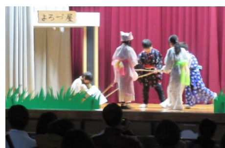
3年 役になりきった素敵な演技