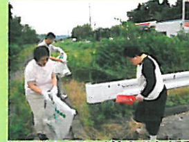
たいやきくん (社会参加活動)