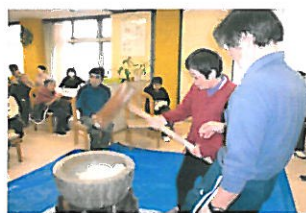
新春もちつき大会