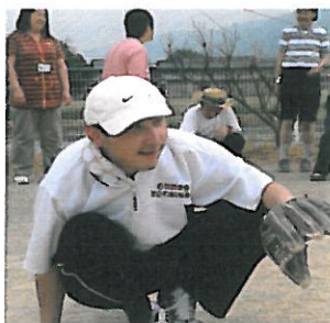
ソフトボール交流試合