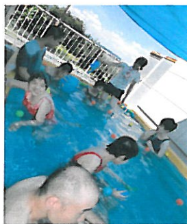
プールでの余暇活動